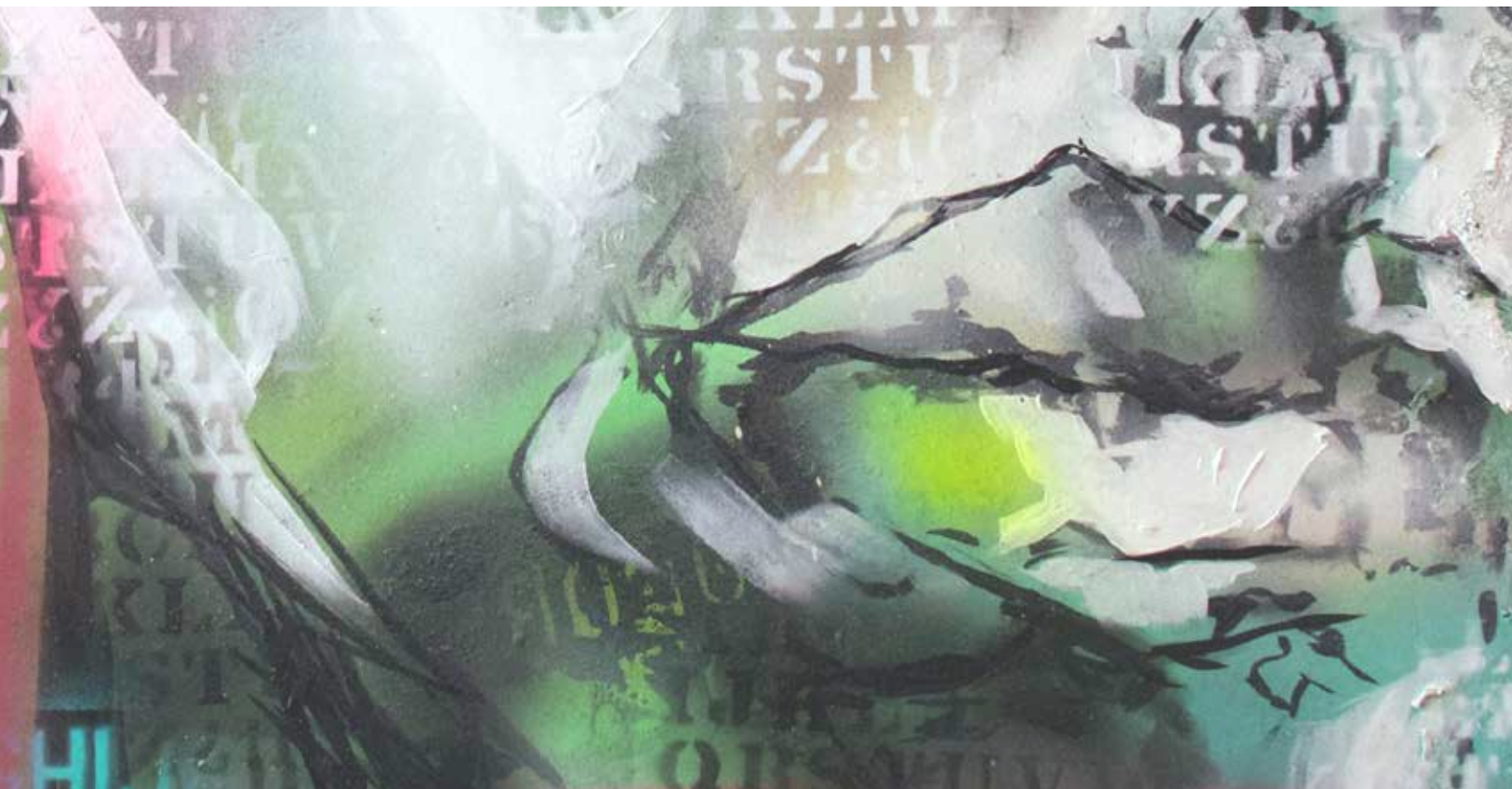
Mario Wence. Detalle.

Nota: El total no da 100% debido a que se omitieron las cifras de progenitores que dejaron incompleto cada nivel.