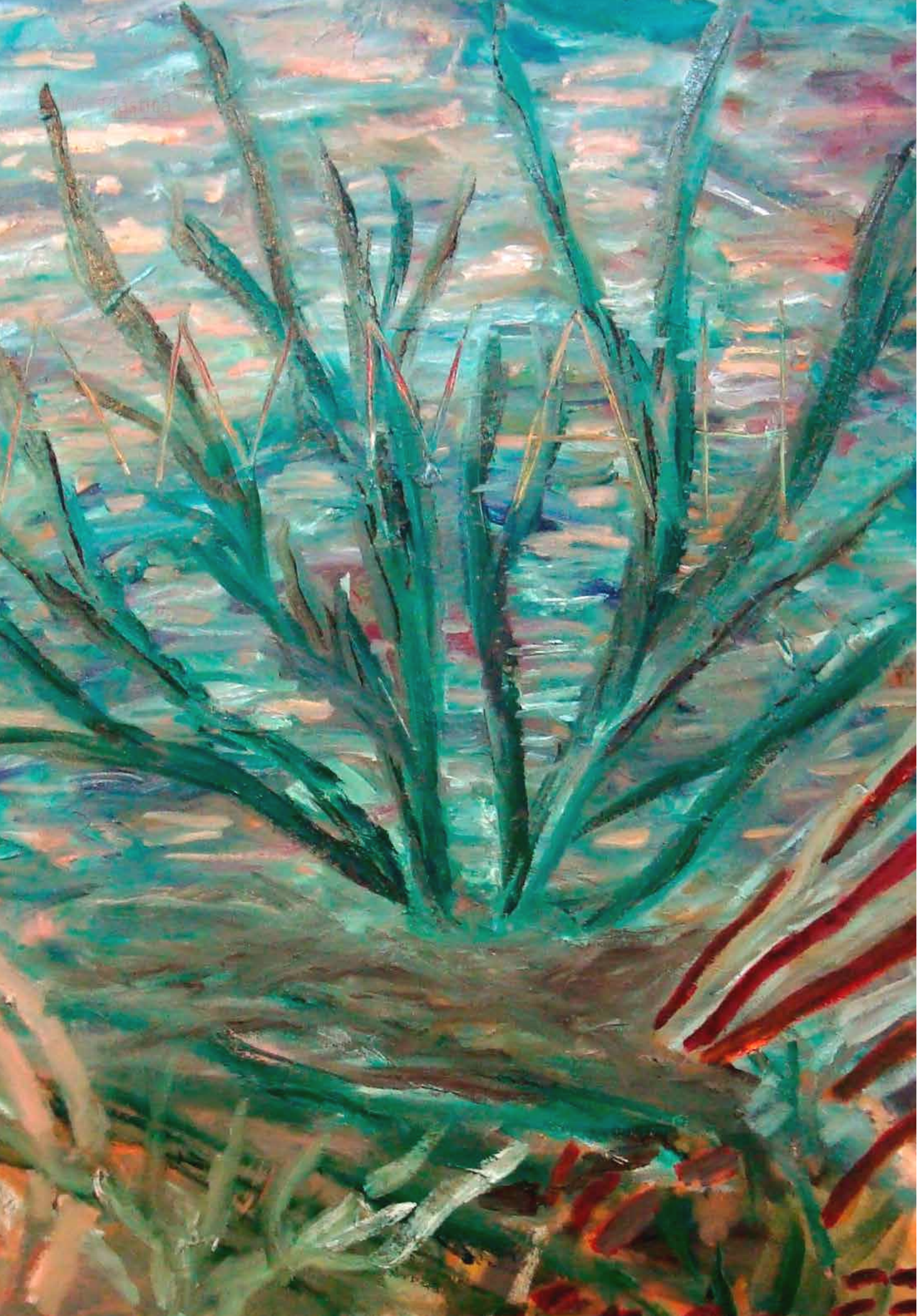
"Paisaje de lo que quedó después de la tormenta, Anna Gau", óleo sobre tela; 70 x 120 cm; 2014.