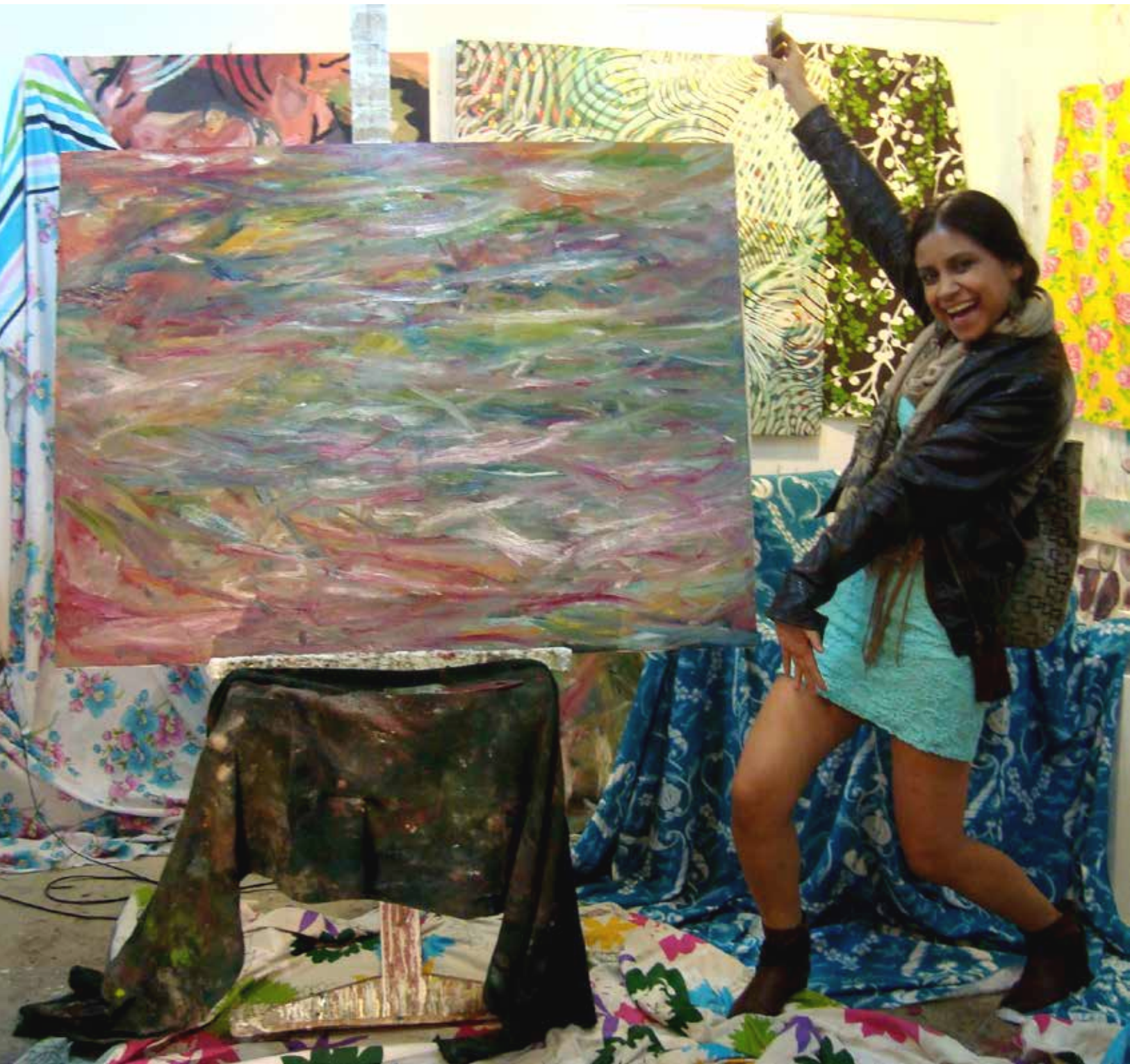
"Mujer desnuda, Mujer vestida, Viridiana"; fotografía digital; 2014.