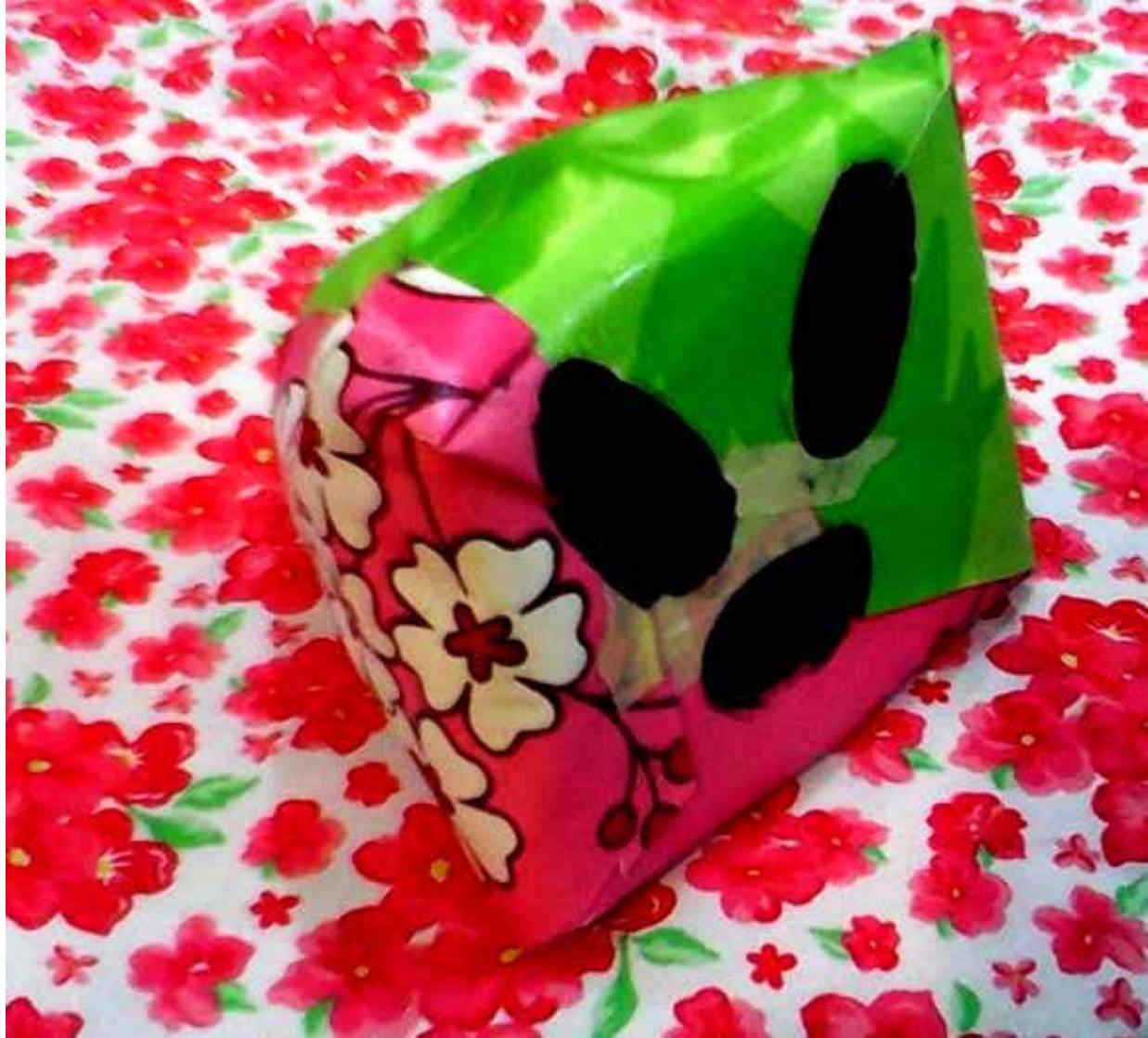
"Ser de Otro Mundo S0456"; escultura en vinyl estampado relleno de espuma de estrellas; 20 x 25 x 25 cm.; 2014

Con esta exposición Antonio Gritón alcanza lo que Jean Cocteau decía sobre la pintura abstracta que, según él, tenía la capacidad de crear naturalezas ya que su origen no es la imitación de lo que existe, sino la creación de realidades nuevas. De esta manera, Gritón crea paisajes con tintes naturales pero que no 'recrean' nada de lo real porque el paisaje en realidad no existe; y desnudos que, aunque esos sí son reales y cada uno lleva su nombre, hay que inventarlos con la imaginación porque la imagen no es la representación de lo visto, sino de lo capturado a través de la más abierta y franca emoción.