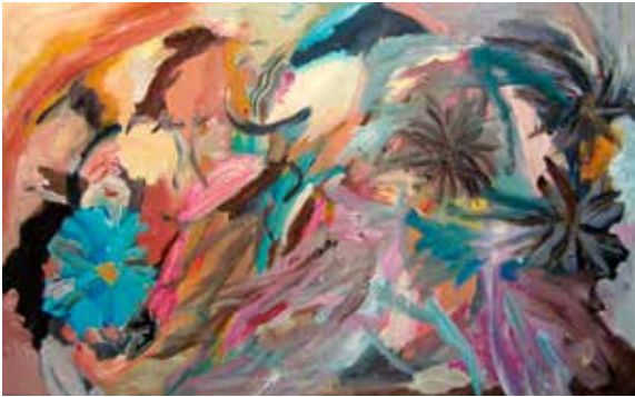
“Mujer desnuda rodeada de todas las flores, Viridiana”; óleo sobre tela; 70 x 130 cm; 2014.